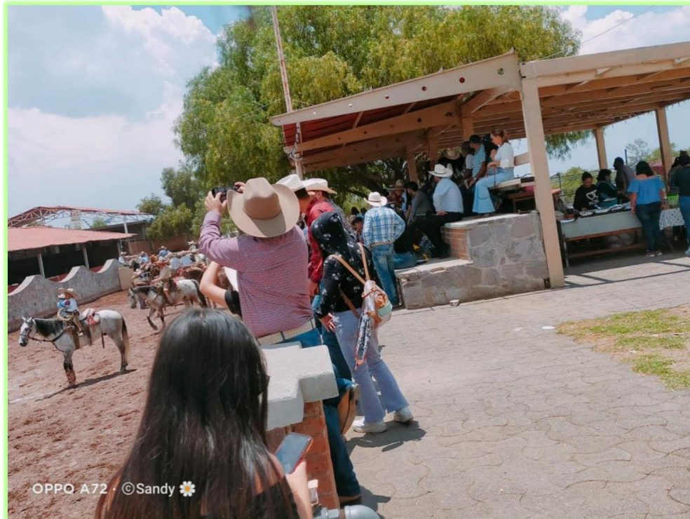
Imagen 7 Familiares, tutores y amigos como asistentes al campeonato

desempeño. En la siguiente imagen (ver imagen 8) pueden observarse algunos de los asistentes a este campeonato.