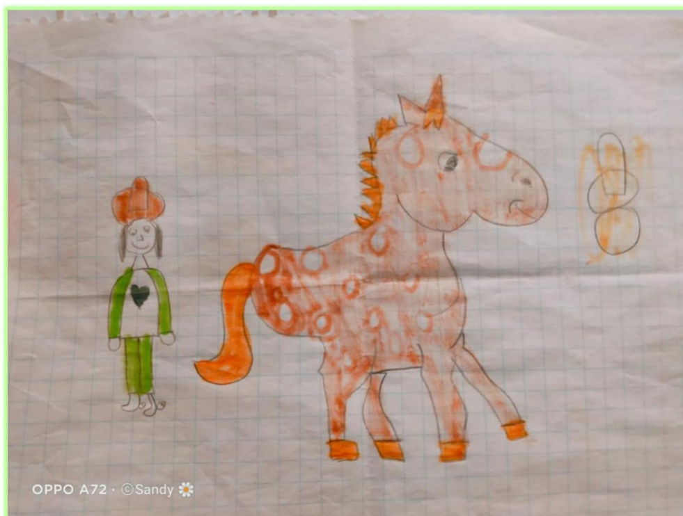
Imagen 14 Dibujo de Brenda

“Es mi caballito... Se llama Chiquita porque era nueva y entonces... Entonces se veía muy bonita y es color café... Ella soy yo. Chiquita es un poco bebé, pero ya va creciendo... Me siento feliz con Chiquita porque este... Está conmigo y no me siento solita... Se porta bien y me enseñó a montar...” (ver imagen 14)