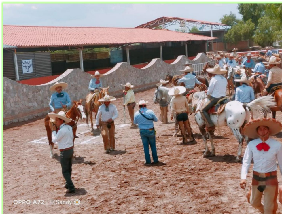
Imagen 12 Convivencia entre todos los competidores charros