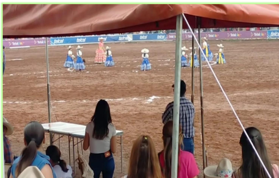
Imagen 3 Presentación de escaramuzas con sus caballitos de palo en FICT 2023

Exhibición: La participación de los niños en las exhibiciones consiste en su ejecución pública de las rutinas. Es decir, es la exposición de las suertes que practicaron durante los entrenamientos. En el caso de las fotos siguientes, la exhibición fue en la Feria Internacional de Caballo (FICT) 2023, en donde en público mostraban las ejecuciones practicadas. En el caso de las niñas, durante las exhibiciones se presentan con caballitos de palo y durante el proceso son apoyadas por su instructora que las va orientando en todo momento. Sus ejecuciones son a pie y, a diferencia de los entrenamientos, las niñas portan el traje de escaramuzas, que consta de un moño en la cabeza, adornos en la parte del cuello, mangas largas, banda en la parte de la cintura, rebozo, crinolina, falda, botas y su respectivo sombrero, tal como es la tradición del deporte. Durante sus exhibiciones las niñas aprenden a controlar sus emociones, pues a pesar de que el nerviosismo está presente durante su participación, son capaces de realizar las figuras de la mejor manera. También desarrollan la autonomía al ya no tener a sus tutores cerca de ellas para decirle qué hacer, la autonomía se hace presente, pues ellas son quienes se responsabilizan de su ejecución en cada presentación (ver imagen 3).