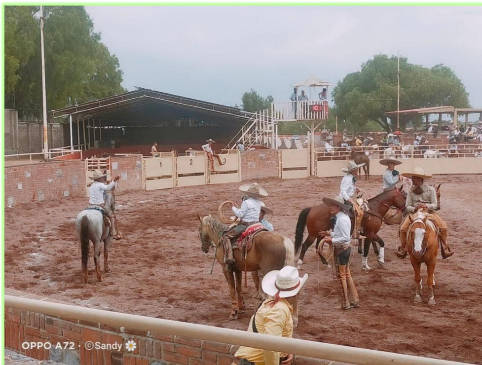
Imagen 11 Apoyo y trabajo en equipo