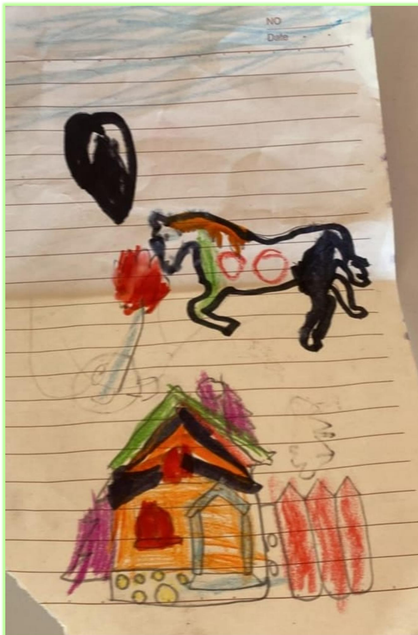
Imagen 13 Dibujo de Magaly

“Este es un caballo y esta es una casa, estas son las rendijas que le ponieron (sic) a la casa y está la planta... Por eso le hace así... Se llama Junior, lo quiero mucho y su pelo a veces se le encima, se lo pinta y se le ve muy bonito... Junior es muy bonito porque me quiere mucho y me ha enseñado que a veces las personas son buenas, pero a veces cuando se ponen buenas... A veces los años se ponen malas...” (ver imagen 13)