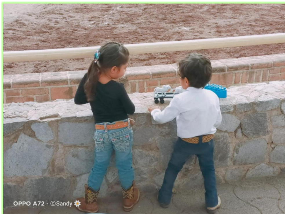
Imagen 8 Niños espectadores con vestimenta alusiva a la charrería